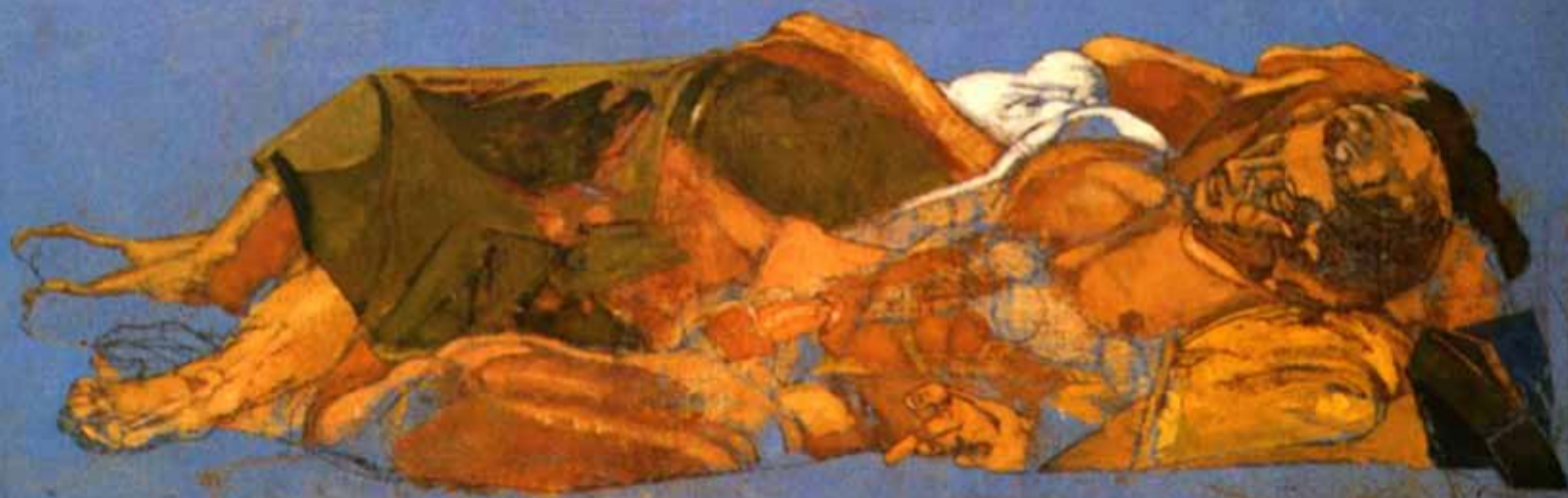
Lorenzo Tornabuoni: "Amanti sulla spiaggia"

SCUOLA DI SPECIALIZZAZIONE IN PSICOTERAPIA INTERATTIVO-COGNITIVA