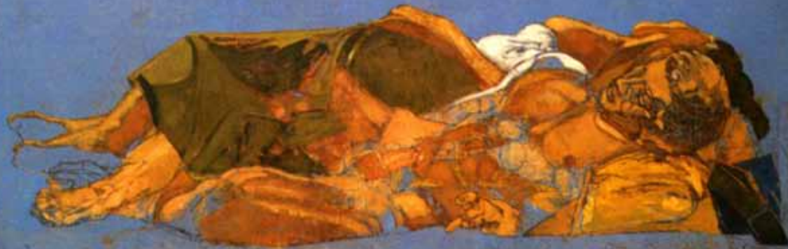
Lorenzo Tornabuoni: "Amanti sulla spiaggia"

MESTRE PADOVA Scuola di specializzazione in Psicoterapia Interattivo-Cognitiva